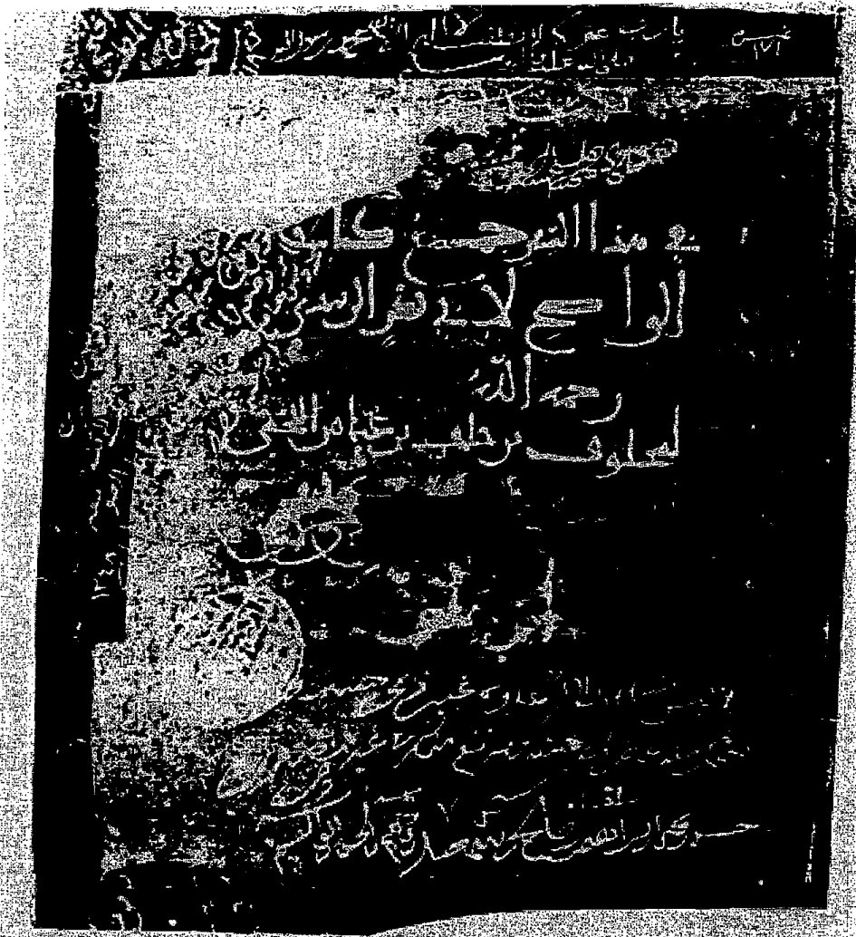
هذه النسخة المصنوعة عن نسخة النجاشي الكبير (ص ١٠٠) ، وهي على عنوان الكتاب ، وتسمى النسخة التي كتبت له هذه النسخة ، وكذلك توقيعات وتعليقات منها ، في الحمد لله ، هذا م من كتبت الوقف ، مقبولاً من عقار أمير المؤمنين ، المتوكل على الله ، حفظه الله ، وأحياناً به معالم الدين ، وأمر بوضعه في المكتبة العامة الجامعة بكتب الوقف ، بمحروص جامع صنعاء ، التي أمر بمعالجتها على الصيغة الشرقية ، وحررت بتاريخه شهر ربيع أول سنة ١٣٤٨ هـ ، وقد كتبت النسخة بخاتم المكتبة التركية ، وتظهر هذا الختم في واضح صريحة أيضاً .